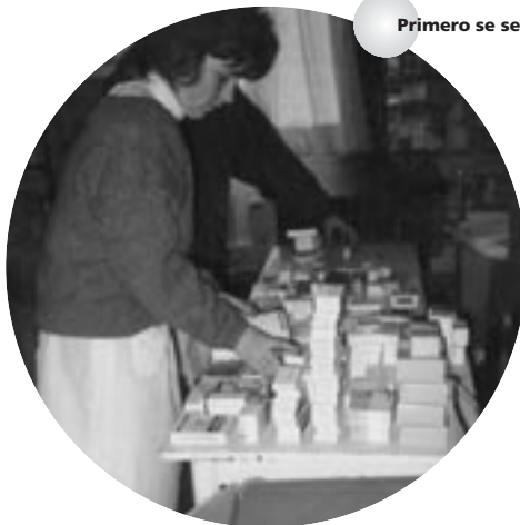
Primero se selecciona