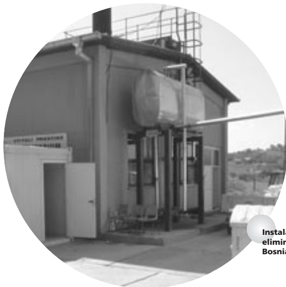
Instalación de eliminación en Bosnia-Herzegovina