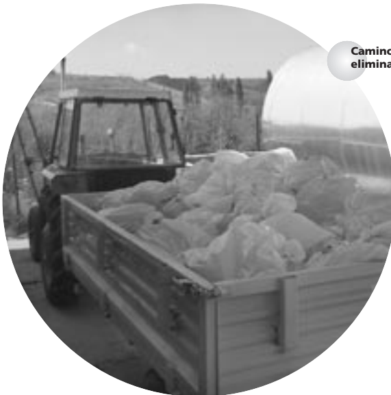
Camino de la eliminación

Los vertederos bien diseñados garantizan una eliminación relativamente segura de la basura doméstica y, también, de medicamentos (4). Estos vertederos deben estar por encima del nivel del agua subterránea y haber sido impermeabilizados contra corrientes de agua. Los suministros diarios de basura deben ser compactados y tapados con tierra continuamente. En caso necesario, infórmense en la O.M.S. de como se puede equipar un vertedero no controlado (5).