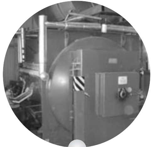
Eliminación de citostáticos: p.ej. en hornos de alta temperatura